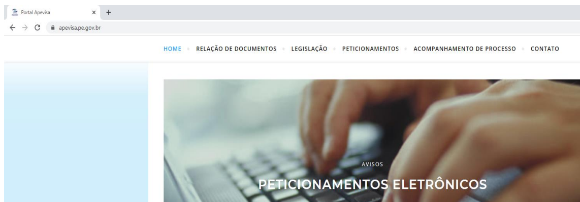
Figura 4 - Acompanhamento de processo

Após a análise dos documentos anexados o regulado poderá acompanhar o processo pela seção “Acompanhamento de Processo”, por meio do número de CNPJ (figura abaixo).