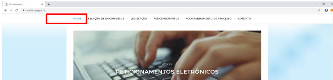
Figura 1- Relação de documentos

Neste espaço você pode verificar a relação de documentos necessários para instruir seu processo. Abaixo se encontram os assuntos disponíveis para peticionamento.