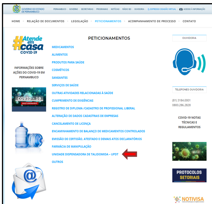
Figura 1 - Página do peticionamento eletrônico.

Ao clicar na opção “UNIDADE DISPENSADORA DE TALIDOMIDA – UPDT”, o interessado deverá escolher qual o tipo de solicitação ele deseja realizar, conforme indicado na Figura 2: