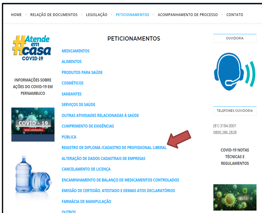
Figura 5 – Página do peticionamento eletrônico

O formulário de peticionamento eletrônico deverá ser preenchido conforme indicado na Figura 6: