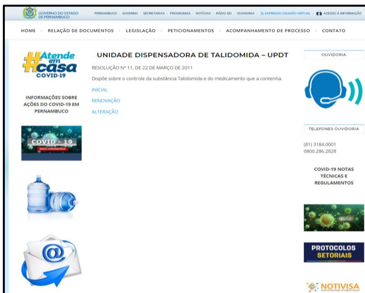
Figura 2 - Tipos de Solicitação

Em seguida, o interessado deverá preencher o formulário correspondente e anexar o arquivo com os documentos de instrução já mencionados, conforme Figura 3.